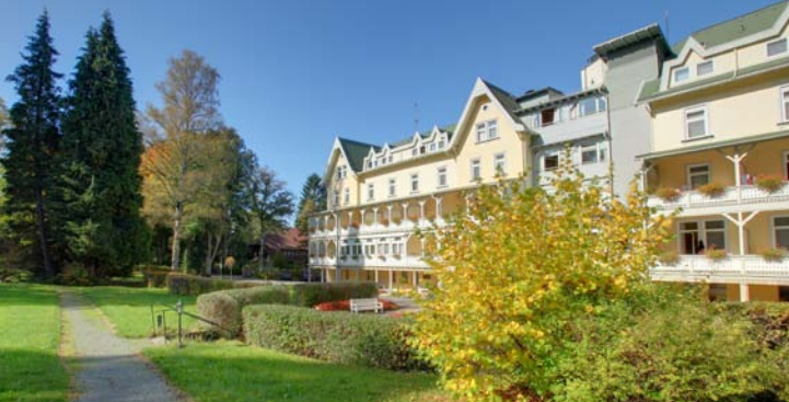
Die Celenus Klinik Schömberg