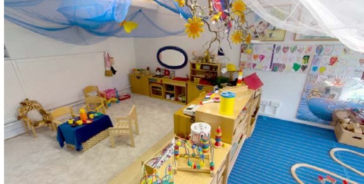
Spielzimmer mit Puppen- und Bauecke