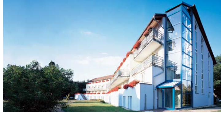
Celenus Algos Fachklinik