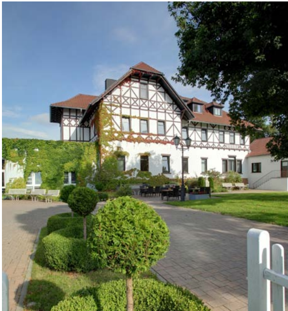
Celenus Algos Fachklinik

Weiterführende medizinische Spezialuntersuchungen (z. B. Röntgen, CT, MRT, Szintigraphie) erfolgen bei Bedarf in Kooperation mit naheliegenden Krankenhäusern und niedergelassenen Fachärzten.