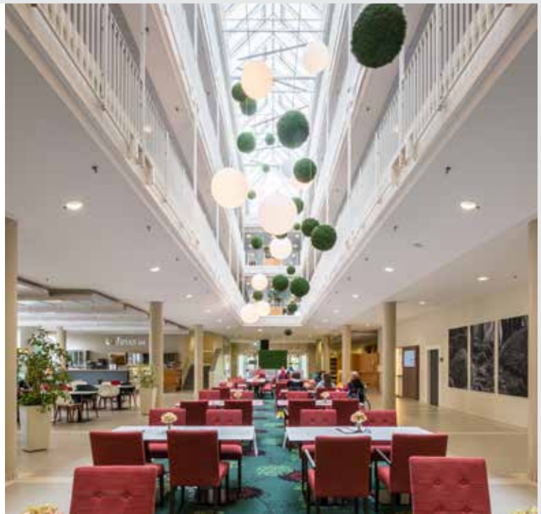
Eindruck vom Reha-Zentrum