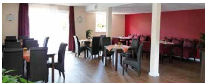
Beispiel Gästezimmer/Speisesaal im Gästehaus

Unser modernes Haus liegt in einer landschaftlich reizvollen Lage und hat den Dieksee direkt vor der Tür. Es ist ein idealer Ausgangspunkt für Wanderungen, Radtouren und Nordic-Walking Training. Sie finden bei uns hell und freundlich eingerichtete Einzelzimmer mit Bad und WC, Schwesternnotruf und Telefon. Alle Zimmer sind mit modernen TV-Geräten in HD-Qualität ausgestattet. Zum Programmumfang gehört unter anderem Sky-Bundesliga. Wenn Sie in Begleitung zu uns kommen, reservieren wir Ihnen gerne eines unserer Zweibettzimmer. Ein vielseitiges Frühstücks- und Abendbuffet überrascht Sie mit allerlei gesunden Leckereien. Bei unseren ausgewogenen und individuell zubereiteten Mittagsgeschichten sind die verschiedenen Fischgerichte aus dem „Land zwischen den Meeren“ stets ein Genuss. Nutzen Sie unsere vielseitigen Freizeitangebote. Im Bewegungsbad (30° C), im medizinischen Trainingsraum, in der Sauna, der Kegelbahn oder der gemütlichen Cafeteria mit Sportsbar können Sie nach Lust und Laune aktiv sein oder einfach mal abschalten. Gerne laden wir Sie auch zu Ausflugsfahrten in die Holsteinische Schweiz oder zu unseren Tanz- und Musikabenden ein.