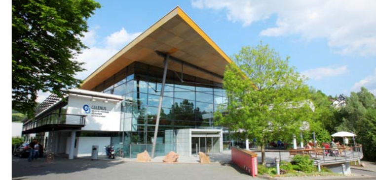
Die Celenus Klinik für Neurologie Hilchenbach