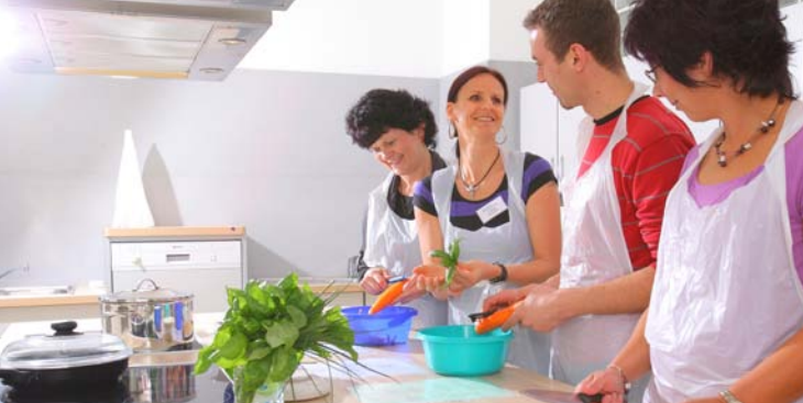
Ernährungstherapie in unserer Lehrküche