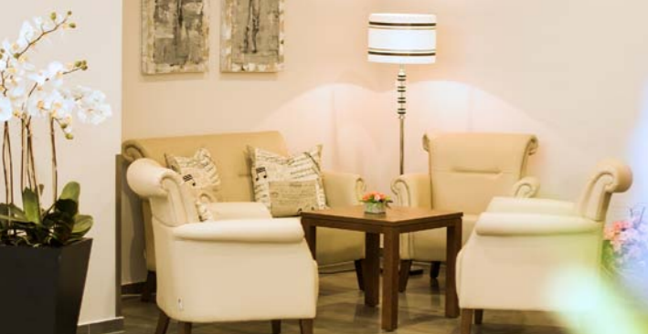
Sitzgruppe im Eingangsbereich der Alloheim Senioren-Residenz „Haus am See“