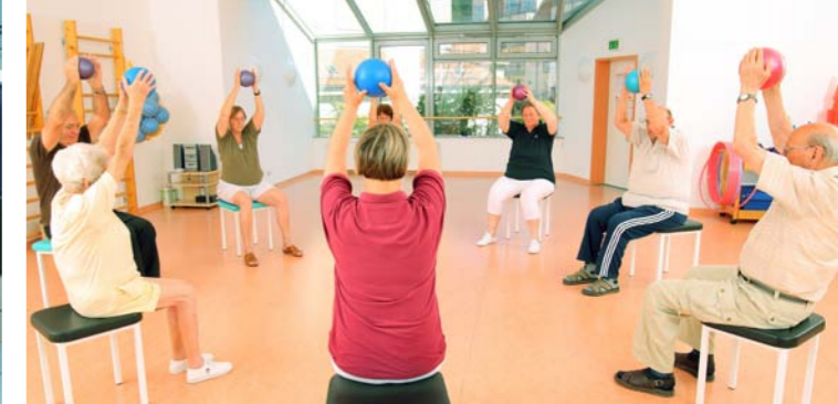
Gruppentherapie im Celenus Fachklinikum Sachsenhof