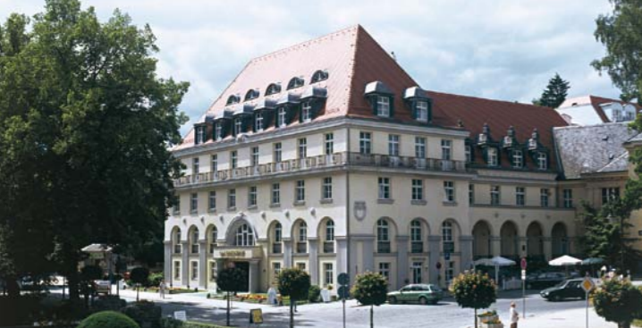
Celenus Fachklinikum Sachsenhof