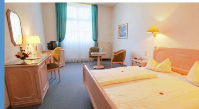
Patientenzimmer des Celenus Fachklinikum Sachsenhof

Ist eine Pflegeperson wegen Urlaub, Rehamaßnahme, Krankheit oder anderer Gründen an der Pflege ihres Angehörigen gehindert, übernimmt die Pflegekasse die Kosten einer notwendigen Ersatzpflege für längstens vier Wochen je Kalenderjahr.