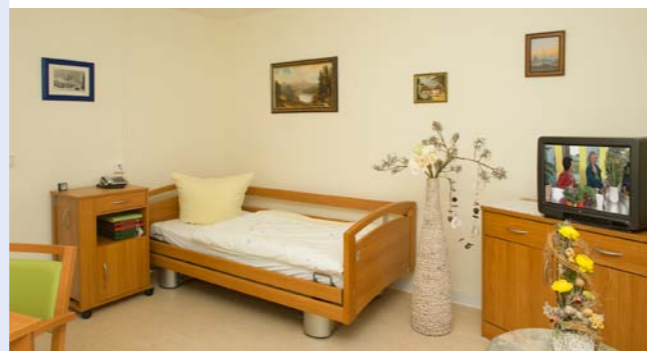
Bewohnerzimmer der Alloheim Senioren-Residenz „Haus am See“

Viele Betroffene bezahlen für das tapfere Durchhalten mit ihrer Gesundheit: Erschöpfungszustände, depressive Verstimmungen, Angst, psychosomatische Erkrankungen und chronische Schmerzen sind häufig die Folge der dauerhaften Überforderung. Erschwerend kommt hinzu, dass eine große räumliche Trennung vom Pflegebedürftigen für die pflegenden Angehörigen oft gar keine Erleichterung sondern eher noch eine weitere psychische Belastung darstellt. Denn häufig ist nicht sichergestellt, dass der Pflegebedürftige während der Abwesenheit seines Pflegers trotzdem die qualitativ hochwertige Pflege bekommt, die er braucht. Viele Pflegenden verzichten deshalb auf das notwendige Auffüllen der eigenen Ressourcen.