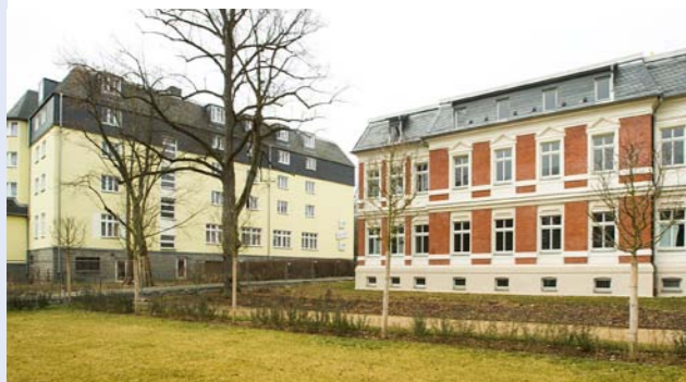
Außenansicht der Alloheim Senioren-Residenz „Haus am See“