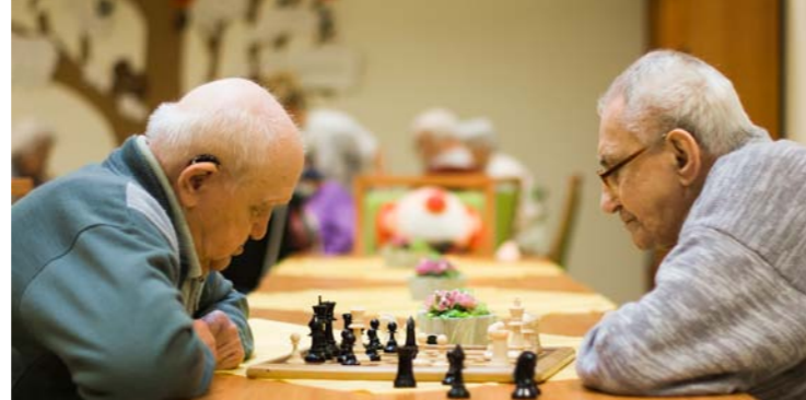
Ergotherapie der Alloheim Senioren-Residenz „Haus am See“