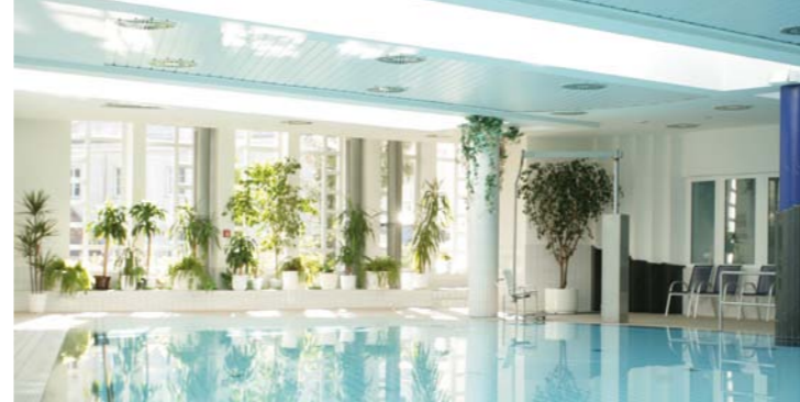
Schwimmbad des Celenus Fachklinikum Sachsenhof