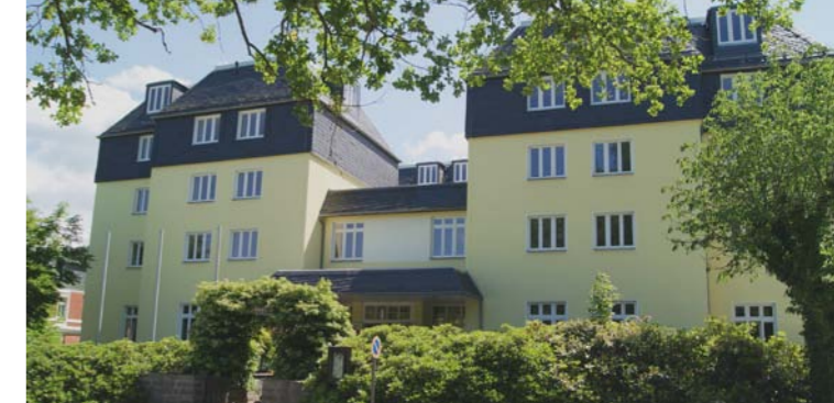
Alloheim Senioren-Residenz „Haus am See“