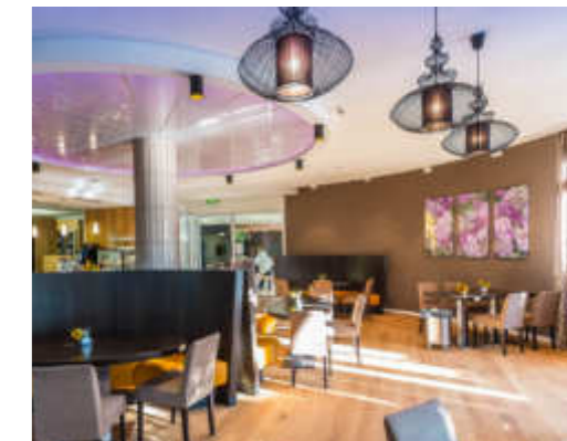
Das Schwarzwald-Café lädt zum Besuchen ein.