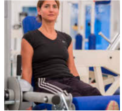
Patientin bei der MTT