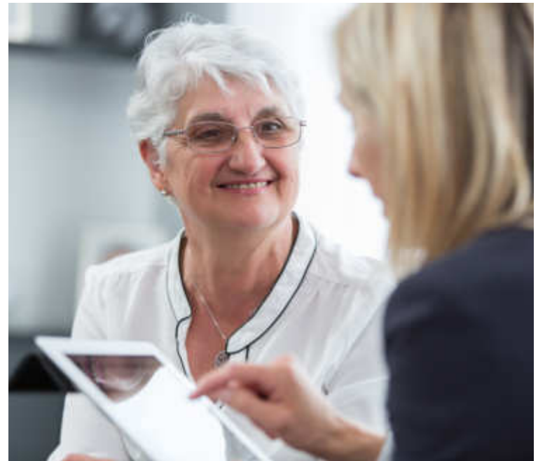
Wir bieten Beratung und Unterstützung.

Gemeinsam mit dem Patient und den Angehörigen erarbeiten wir ein tragfähiges Konzept für die nachstationäre Versorgung.