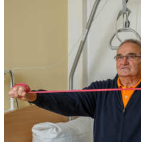
Beispielhafte ergotherapeutische Anwendungen.