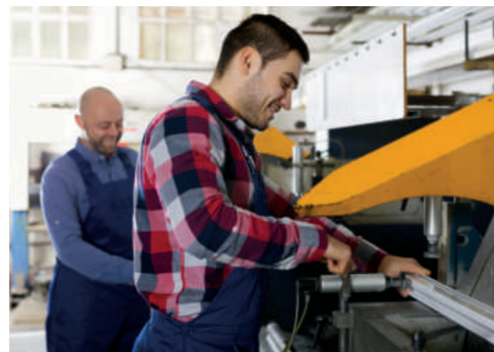
Für viele Ihrer Fragestellungen gibt es hervorragende Angebote.

Um den komplexen Anforderungen auf diesem Gebiet zu entsprechen und eine optimale Behandlung und Diagnostik zu gewährleisten, erarbeiten wir für jeden Patienten ein hochspezialisiertes, individuelles Leistungsangebot.