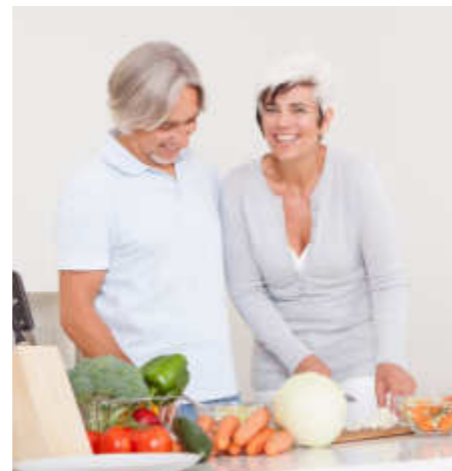
Alltagstraining in der Küche