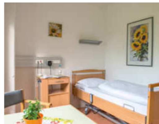
In unseren hellen Zimmern werden Sie sich wohlfühlen.