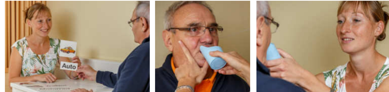
Für Patienten mit Schluckstörungen gehört die geeignete Kost mit zur Therapie.