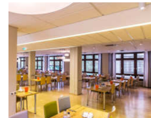
Und in unserem Speisesaal wird Ihnen das Essen schmecken.