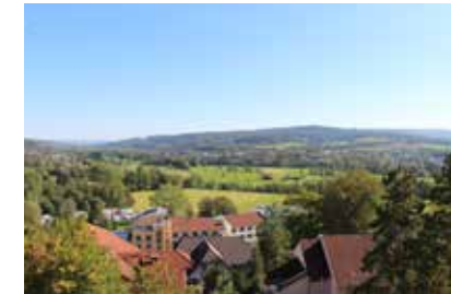
Herrlicher Blick über den Spessart - Natur pur!

Die Klinik Bellevue liegt direkt am Waldrand mit einem wunderschönen Blick über Bad Soden-Salmünster, das Kinzigtal und den Spessart. In nur wenigen Minuten erreichen Sie den Kurpark mit Generationenpark und Fontänengarten und die Spessart Therme mit Spessart FORUM. Direkt hinter der Klinik liegt der Sodener Stadtwald mit Wildpark, Walderlebnispfad sowie schönen Wander- und Spazier-Rundwegen.