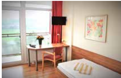
Wohnbeispiel eines Einzelzimmers

Falls Sie in Begleitung anreisen möchten, bieten wir Ihnen in begrenztem Umfang auch die Möglichkeit, eines unserer geräumigen Doppelzimmer zu reservieren.