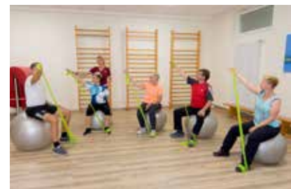
Übungen in der Gruppe sind motivierend!