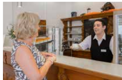
Wie wär's mit einem leckeren Cappuccino in unserem Café?

Unser hauseigenes Café „Schöne Aussicht“ bietet Ihnen am Nachmittag eine große Auswahl an frischen Torten und Kuchen, herzhaften Snacks, Süßigkeiten und ausgewählten Kaffeespezialitäten.