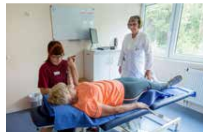
Die Therapie ist individuell auf Ihre Erkrankung abgestimmt

Bei der Bewältigung der körperlichen und seelischen Folgen Ihrer Erkrankung und der Suche nach Antworten auf Ihre Fragen sind Sie nicht allein. Wir stehen Ihnen mit unserem gesamten Team zur Seite.