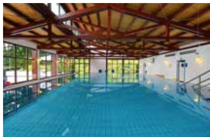
Unser Schwimmbad mit 32° Wohlfühltemperatur

Unser Haus verfügt über großzügige Aufenthaltsräume mit besonderem Flair. Plauschen Sie in unserem gemütlichen Café „Schöne Aussicht“ bei einer duftenden Tasse Cappuccino, verweilen Sie bei einem guten Buch in unserer Lesecke, amüsieren Sie sich bei unseren abwechslungsreichen Abendveranstaltungen oder lassen den Abend mit einer Partie Billiard ausklingen. Unser modernes Schwimmbad mit 32° Wohlfühltemperatur und harmonischer Farblichtgebung sowie die Sporthalle für Ihre Freizeitaktivitäten runden das Angebot ab.