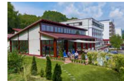
Außenansicht der Klinik

Während Ihres Krankenhausaufenthaltes kann über Ihren Klinikarzt oder den Sozialdienst eine Anschlussrehabilitation (AHB/AR) beantragt werden. Auch bei einer ambulanten Bestrahlung oder Chemotherapie kann eine Anschlussrehabilitation (AHB/AR) von Ihrem zuständigen behandelnden Arzt eingeleitet werden. Sie selbst haben die Möglichkeit, über das sogenannte Wunsch- und Wahlrecht, die Wahl Ihrer Klinik mitzubestimmen. Wenn erhebliche Funktionsstörungen vorliegen, kann im Einzelfall auch bis zum Ablauf von zwei Jahren nach der Erstbehandlung eine weitere Rehabilitation stattfinden. Den Antrag hierfür können Sie mit Unterstützung Ihres zuständigen behandelnden Arztes bei Ihrer Renten- oder Krankenversicherung stellen (Formulare erhalten Sie z.B. unter www.driv-bund.de ). Weitere Informationen erhalten Sie von den Servicestellen für Rehabilitation ( www.reha-servicestellen.de ) und Krebsberatungsstellen.