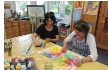
Hier ist Kreativität gefragt

Neben den speziell auf Sie abgestimmten Behandlungen sollten Sie auch einmal Ihre Seele baumeln lassen. Eine Vielzahl von Kreativkursen und Kulturangeboten bieten Abwechslung und Anregung. Unter Anleitung und in Eigenregie entstehen in unserer Kreativwerkstatt Ihre schönsten Werkstücke. Nehmen Sie teil an Wanderungen und Ausflugsfahrten und lernen Sie die reizvolle Spessartlandschaft mit ihren herrlichen Naturwäldern kennen. Erfreuen Sie sich am vielseitigen Veranstaltungsprogramm mit Konzerten, Theater und Kinoabenden im Spessart FORUM.