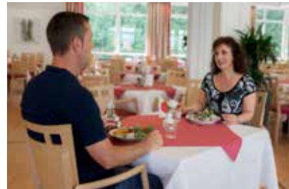
Ausgewogene und abwechslungsreiche Mahlzeiten erwarten Sie

Unsere Küche genießt einen sehr guten Ruf. Wir bieten Ihnen gesunde, ausgewogene sowie abwechslungsreiche Speisen, die täglich frisch von unserem hauseigenen Küchenteam zubereitet werden. Wählen Sie einfach Ihr Lieblingsgericht vom Buffet. Selbstverständlich werden auch spezielle Diät- und Sonderkostformen (u.a. allergenfreie Kost) angeboten. Unsere Diätassistentinnen beantworten Ihnen gerne alle ernährungsbezogenen Fragen.