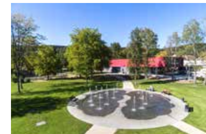
Der Kurpark lädt zum Verweilen ein

Bad Soden-Salmünster ist ein idealer Ausgangspunkt für viele unvergessliche Wanderungen, liegt der Ort doch direkt am Fuße der waldreichen Mittelgebirge Vogelsberg, Rhön und Spessart. Mit Gelnhausen und Steinau a. d. Str. in der Nachbarschaft erwarten Sie mittelalterliche Städte mit besonderem Flair. Auch die Nähe zur Barockstadt Fulda lädt zu einem Entdeckungsausflug in den berühmten Dom, die fürstlichen Gärten und die Orangerie ein. Die Großstadt Frankfurt am Main mit Zeil, Mainufer und vielen Sehenswürdigkeiten erreichen Sie ebenfalls innerhalb von 45 Minuten bequem mit der Bahn.