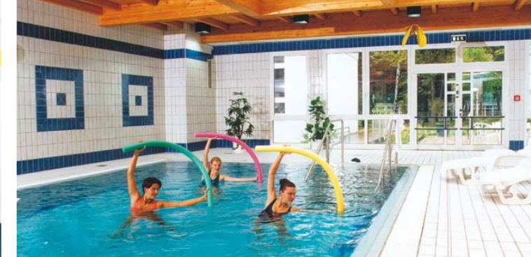
Wassergymnastik im Schwimmbad