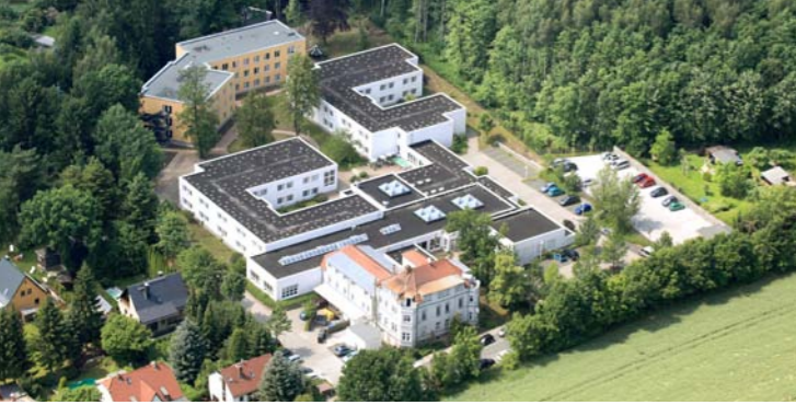
Celenus Klinik Carolabad